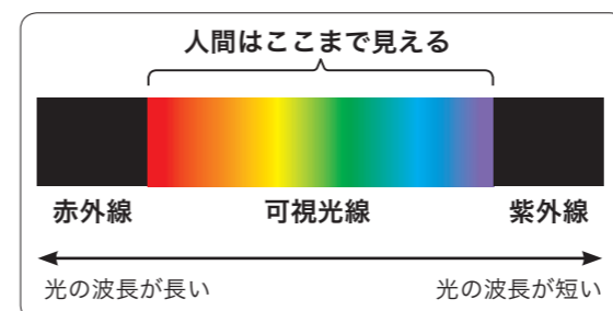
図：地上に届く太陽光の種類

ウシを飼っている皆さんも、ウシの见えている景色を想像しながら接してみたいかがでしょうか?ウシ達の目線に立つことができ、より良い飼養管理が実現するかもしれません。