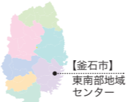
【釜石市】 東南部地域 センター