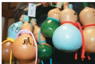
彩りもカラフルな学習瓢箪

「千成瓢箪って言うくらいだから千個は作りたい」という学習瓢箪は、栽培、収穫から加工にいたるまで1つ1つが手作業。5年ほど前から年間80〜100個を作り続け、現在は500個を超えています。瓢箪に書かれている言葉は、日常触れることの多い干支や花き、動植物や農