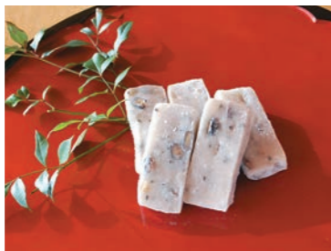
「豆餅」1パック5個入り280円(税込)