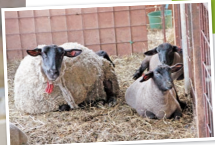
耳標を使って羊を管理