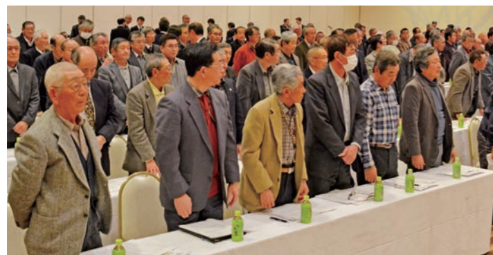
全議案が可決承認されました