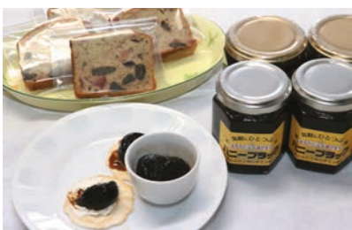
お菓子づくりの材料としても活躍

材料には、県産の黒ニンニクと青森県産の蜂蜜を使用。「電話やインターネットで情報収集し、直接足を運んで安全・安心な材料を選びました。黒ニンニクと蜂蜜の味の相性も吟味し、納得のいくものを使っています」と、材料にも自信を持っています。