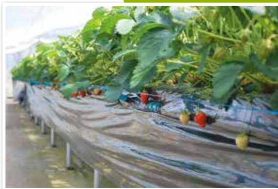
高設栽培システム導入で作業効率もアップ