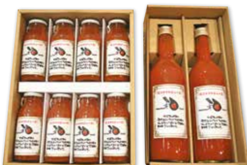
トマトジュースが苦手な方にもおすすめ

家は、阿部さんが初めてです。イチゴの甘さが評判を呼び、J Aいわて花巻「母ちゃんハウス」だあすこ沿岸店」をはじめ、地元のスーパードラッグでは、入荷しただけで売切れるほど注目度が高まっています。