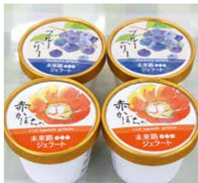
赤かぼちゃジェラート（税込380円）。ブルーベリージェラート（同300円）