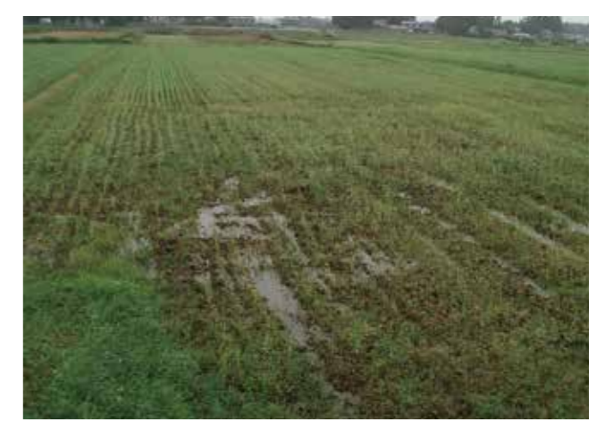
大雨による土壌湿潤害(そば)