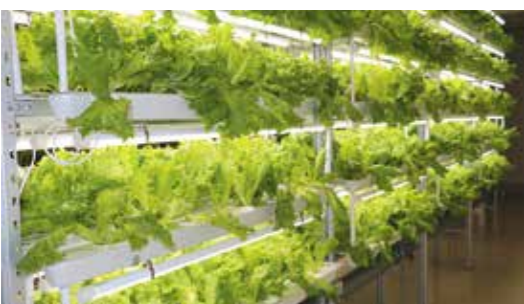
栽培中のレタス。天候に左右されることがなく、安定供給が可能になった