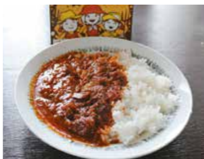
紫波町片寄の「産直あぐり志和」などで販売中