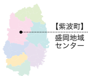
【紫波町】 盛岡地域 センター