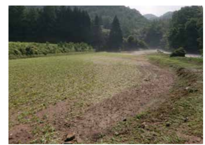
河川の氾濫による土砂流入(大豆)

*全相殺方式は、基準収量について最近5か年の出荷数量で設定しますので、生産量のおおむね全量（95%以上）をJAなどに出荷していることが加入の条件となります。