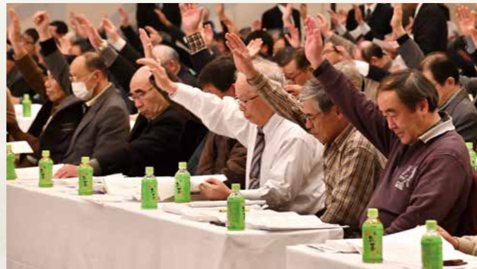
全議案が可決承認されました

また、昨年6月に農業保険法が成立しました。農家ニーズの変化に合わせて農業共済制度が見直され、今年10月からは収入保