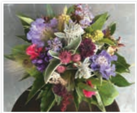
エディブルフラワーのブーケ

さん。収穫から梱包、出荷までは全て手作業。花は、水で1輪ずつ優しく洗い、虫がついていないか細かく確認します。「手間はかかりますが、お客様の喜ぶ顔を思い浮かべながら頑張っています」と丁寧な作業を心掛けています。