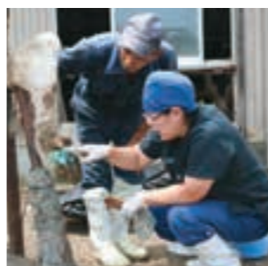
特に蹄病治療はさまざまな病気の予防につながります

これから「NOSA I 岩手家畜診療所」という産業動物の広域総合病院として、一般診療と損害防止事業を両輪に、畜産農家の皆さんのニーズに応えられるよう努力していきますので、よろしく願います。