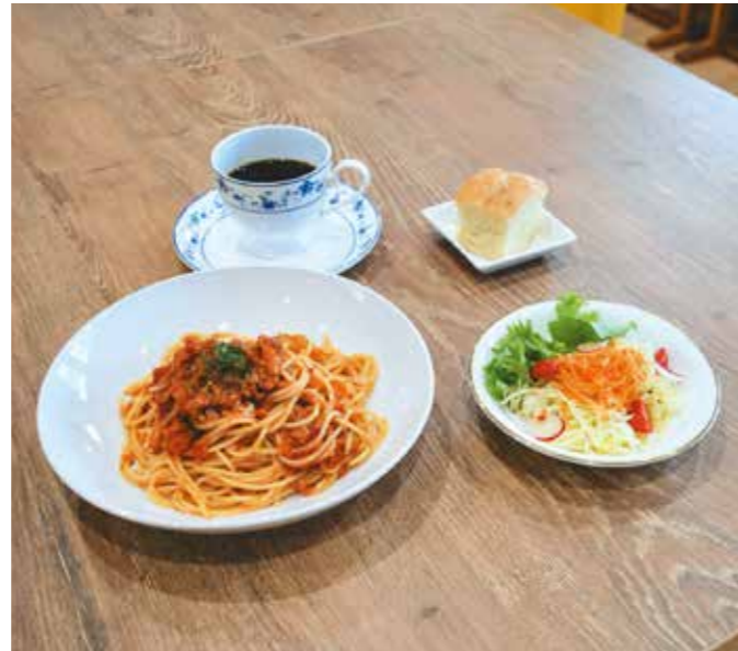
パスタはミートソース、ペペロンチーノの2種類から選べます ランチセット 950円(税込み)

遠野市土淵町にある一般社団法人遠野みらい創りカレッジ(樋口邦史代表理事)の食育カフェ「スクオーラ・カフェテリア・アダージオ」では、遠野産の食材を使用したイタリアンを提供しています。 提供するメニューはパスタやサラダなどのセット。パスタのミートソースには、遠野産の亜麻豚を使用しています。亜麻豚は、アマニ油を配