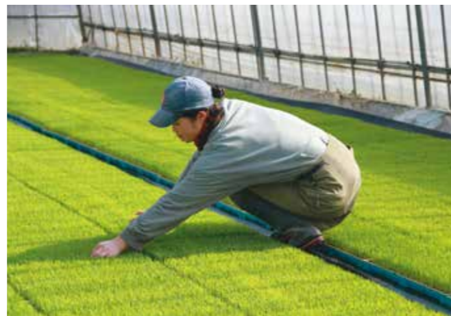
今年の苗も順調に生育しています