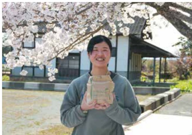
「若い力で農業を盛り上げていきたいです」