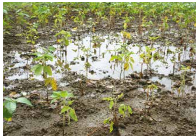
土壌の湿潤状態が続き、生育不良となった大豆(撮影場所:久慈市)

られました。その後、開花時期の8月下旬に低温、降雨があり結実不良が見られました。 開花前の4月中旬から下旬の低温によって凍霜害が発生し、サビや花芽の枯死による品質低下や果数の減少が見られました。 また、5月下旬から6月上旬、8月下旬から9月上旬には、低温と多雨によって黒星病と褐斑病が発生し、品質低下が見られました。