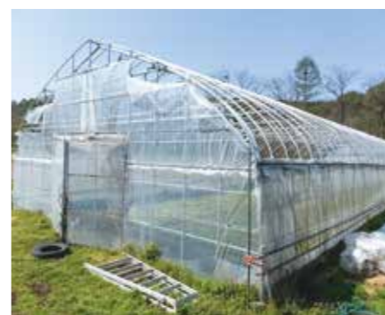
突風被害を受けたハウス (令和4年4月、軽米町)

ビニールを被覆している期間は、ビニールとパイプの両方を補償し、ビニールを外している期間はパイプのみを補償します。