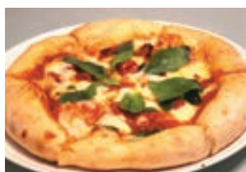
自家製ドライトマトのマルゲリータ