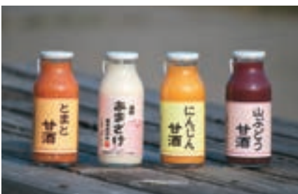
さまざまな甘酒を販売している