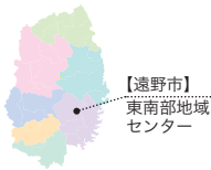
【遠野市】 東南部地域 センター

6 次産業に取り組み遠野市宮守町の農事組合法人「宮守川上流生産組合」（多田誠一組合長）が作る「遠野あまぎけ」が、地元産直などで好評を集めています。