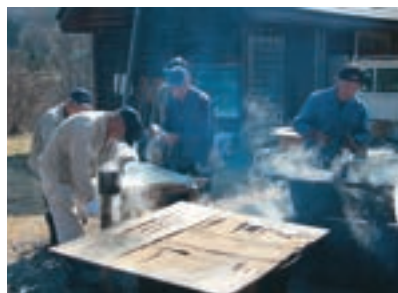
ホダ木は3時間以上煮沸殺菌する

収穫したマイタケは同町内で販売するほか、9月下旬に地元で開催される「田瀬みのりまつり」で振る舞われます。