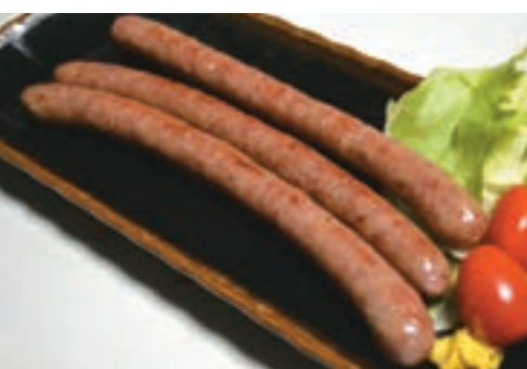
「二戸ぶっとべウイナー」 3本入りで580円(税別) ※冷凍販売

「初めて『ぶっとべ申』をイベントで販売したとき、一日で3千本が売れました。お客さんからは持ち帰りたいという要望もあり、昨年『二戸ぶっとべ