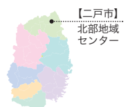
【二戸市】 北部地域 センター

1 戸若手料理人の会（会員12人）の濱豊会長は、仲間と共に、二戸地域のブランド肉3種を使った「二戸ぶっとべ」創作料理を提供。地元食材の消費拡大や産地の魅力発信に力を注いでいます。