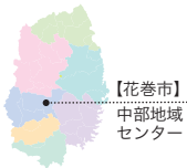
【花巻市】 中部地域 センター