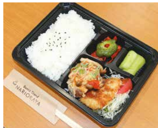
「日替わり弁当」 1個 650円 (税込み)