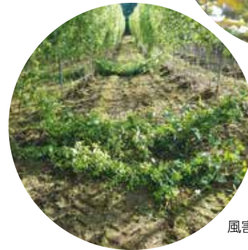
風害で倒れたホップ

令和6年産の麦（全相殺方式・災害収入共済方式）・ホップ・ぶどうの共済金を支払いました。昨年は県内でぶどうの被害が特に多く発生しました。8月上旬から下旬にかけて続いた降雨によって、紫波町では収穫直前に裂果の被害が多発しました。