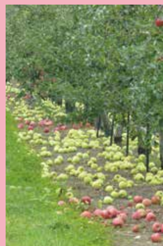
強風によるリンゴの落果

近年、りんごは春先の凍霜害、ぶどうは大雨による裂果が発生しています。また、過去には強風によるりんごの落果被害も発生しています。果樹共済に加入して、自然災害に備えましょう。