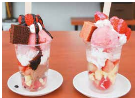
「さんりく星莓のチョコパルフェ (Mサイズ)」 (左)、「さんりく星莓のパルフェ (Mサイズ)」 (右)、店内飲食 750円 (税込み) テイクアウト 730円 (税込み)

同社の太田伸子さんは「カフェには、スロープもあるので車イスや障害のある方でもご来店いただけます」とPRしています。