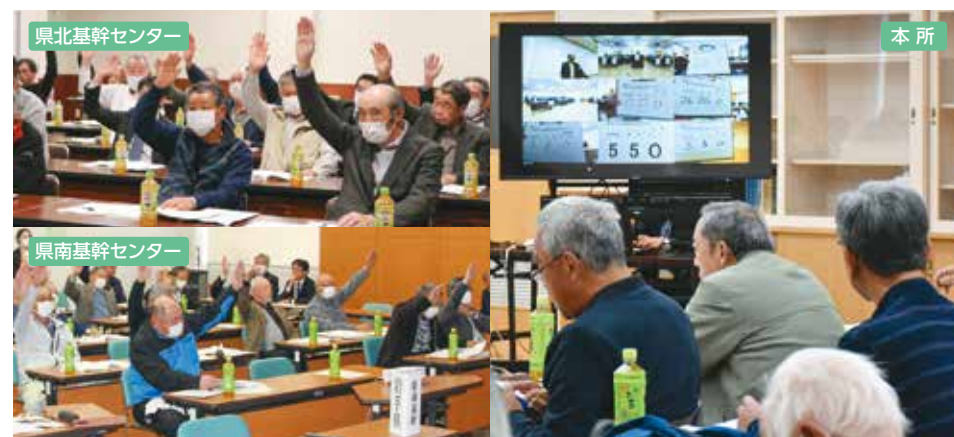
各会場をテレビ会議形式で繋いで開催