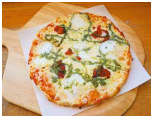
「特製チーズのマルゲリータ」 店内飲食1,320円 (税込み) テイクアウト1,404円 (税・箱代込み)

メニューには、龍泉洞黒豚など岩泉町産の食材を使ったピザもあります。大石さんは「ピザで岩泉の魅力を発信したいです」と話しています。