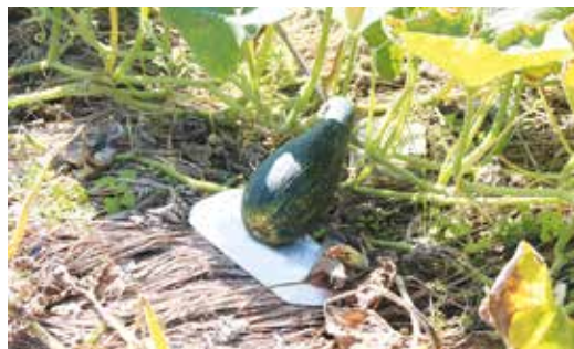
雑草対策として稲わらを敷いて、カボチャの実が地面に触れないように、発泡トレーの上に載せて栽培