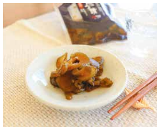
「呑んべえ漬 (辛口)」 324円 (税込み)