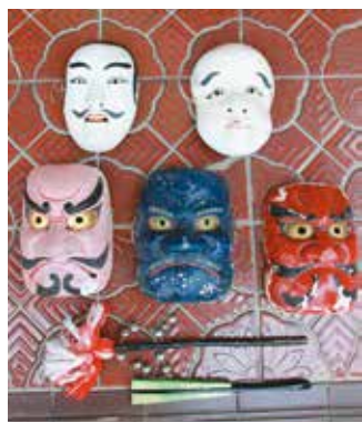
神楽で使用する道具。 お面は10種類以上あって、演目ごとに使い分ける

昭和35年に奥州市指定無形民俗文化財に指定されている福原神楽は、例祭や地域の祭りで、五穀豊穡を願って演