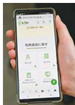
スマートフォンからも申告ができます

国税庁が運営するオンラインサービス「e-tax」を使うと、パソコンやスマートフォンからも確定申告ができます。時間や場所を気にせずに申告できるので便利です。