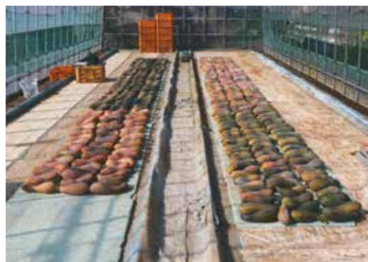
収穫直後は濃い緑色。甘みが増すとオレンジ色に変わる