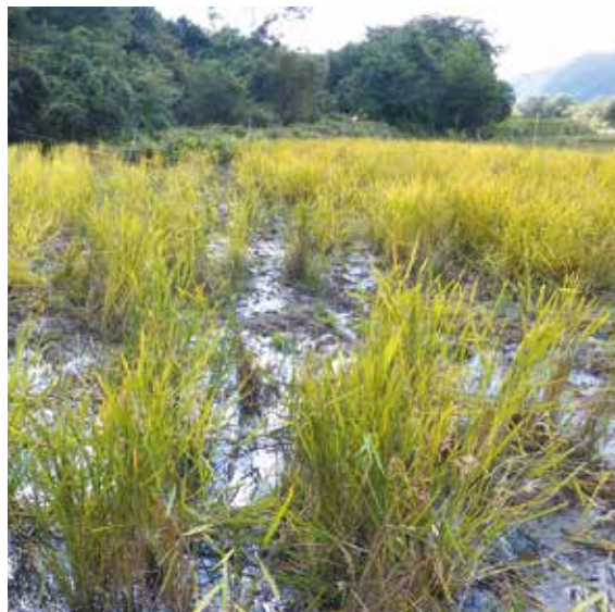
何度もイノシシが寝転んで荒らされた圃場（令和5年10月、遠野市）